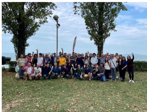
A 2023. évi zamárdi konferencia résztvevői

2021-ben a nulladik rendezvényt (A harmadik út) indult a zamárdi szabadegyetemek programja. 2022-ben a Valóság-hajlítás, 2023-ban Bábel volt a hívószó. A 2024. év rendezvényének címe: Európa elrablása. A zamárdi szabadegyetemen politikusok, tudósok, közéleti emberek mondják el gondolataikat a témáról. A szabadegyetem nyitott, 2024. augusztus 31-ig lehet jelentkezni itt: iroda@bom.hu .